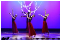
中国舞踊パフォーマンス集団 日本華世芸術団

演目:「灯の中国」 生活の灯の中にある中国の 素晴らしい生活を表現し、 建党百周年とこれからの 輝かしい未来を祈る舞踊。