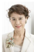
女優・芸術家 栗原小巻