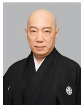
17代目 歌舞伎役者 市村家橘