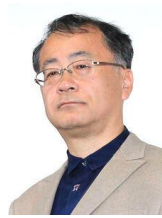
映画監督 金子修介