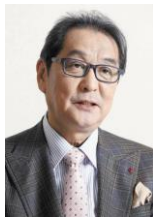
映画監督 滝田洋二郎