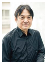
映画監督 本木克英